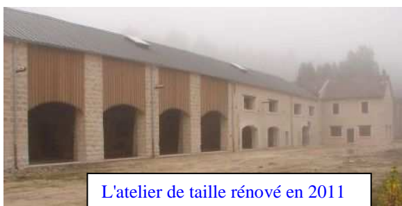
L'atelier de taille rénové en 2011

Nous poursuivrons avec une collation puis, à 13h départ vers Bure visite du site ANDRA, voyage en autocar (tarif de cette visite : 16€ ; membres de l'OT : 14€).