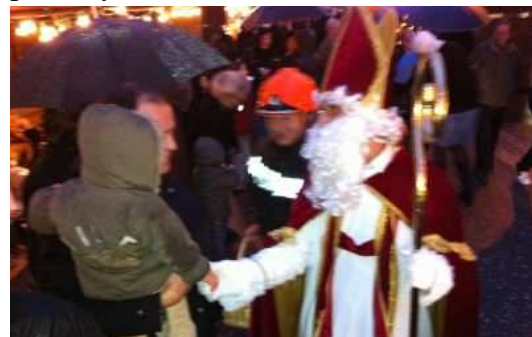
Un Saint Nicolas sous la pluie pour notre 19ème marché

Le numérique n'est pas le seul axe de développement de notre politique de communication. Mise en place, il y a maintenant trois ans, la convention avec la société CCom nous a permis d'assurer avec succès la promotion de la Maison des Truffes et de la Trufficulture auprès des médias régionaux (radio, Tv, presse). Ces actions sont également relayées en presse nationale avec le soutien du CRT et du CDT.