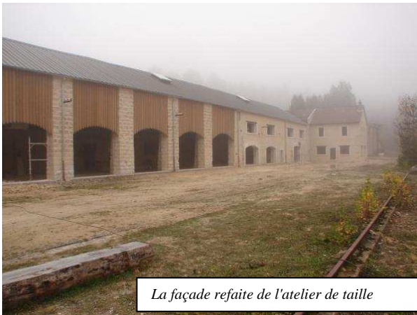
La façade refaite de l'atelier de taille

L'année 2011 touche à sa fin ; c'est une année qui a permis de consolider la nouvelle organisation de notre office de tourisme autour de ses cinq établissements : point I, Maison des truffes, équipe pédagogique des carrières (Adcpe), gîte de groupe de la Villasatel et enfin atelier de taille des carrières d'Euville.