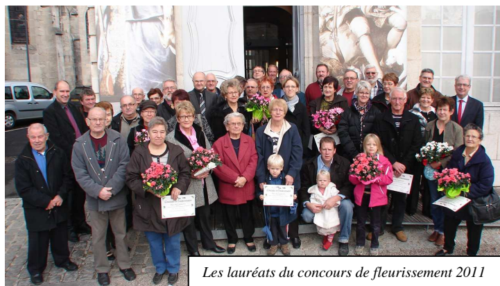
Les lauréats du concours de fleurissement 2011

Comme toute association, l'office de tourisme fonde ses activités sur des membres bénévoles ; des idées d'animations sont à développer, nous songeons notamment à une marche gourmande sur Boncourt autour des thèmes bien sûr de la truffe mais aussi de la madeleine et des vins de Meuse. Ce projet ne sera réalisable que si de bonnes volontés le conforte. A bientôt autour d'une table pour en discuter, donnez nous déjà vos idées.