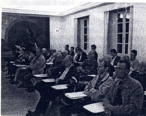
Assemblée générale du 11 avril 2007

Depuis septembre 2005, l'Office de Tourisme présente sur Internet les informations utiles aux visiteurs mais aussi aux habitants du Pays de Commercy : hébergements, visites, patrimoine historique et gastronomique, avec en vedette la madeleine qui attire, rappelons-le, plus de 100 000 visiteurs de l'extérieur chez nos madeleiniens. Le site www.commercy.org s'adresse aussi aux associations qui contribuent par leurs animations à rendre notre pays plus attractif et mieux connu. Il est donc important qu'elles communiquent à l'Office de Tourisme le calendrier de leurs manifestations et animations afin de mettre à jour la publication du calendrier des animations sur le site. Ce calendrier sert aussi à éviter que des manifestations se concurrencent sur une même date.