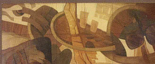
■ "Parabole - Ouragan 1999" Marqueterie de J.J. Jofa Salle du Conseil Municipal, Château Stanislas